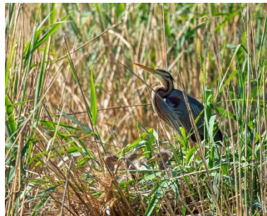
Purpurreiher m. Küken